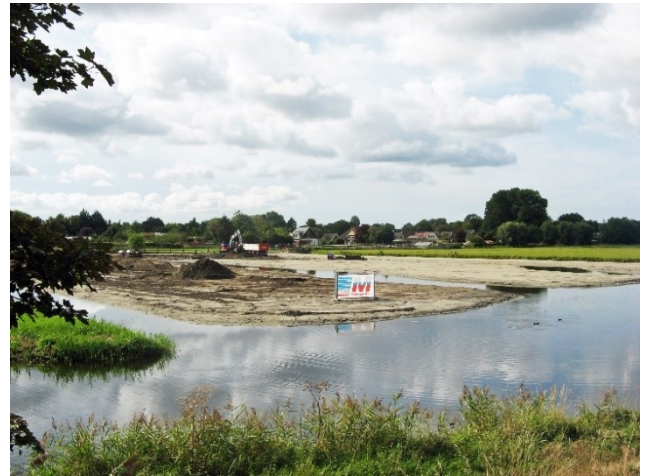
Werk in uitvoering. Een voormalig perceel bollengrond wordt omgevormd tot een waterrijk natuurgebied.

tot een waterrijk natuurgebied van ongeveer twee hectare. De toplaag is afgegraven en slootkanten zijn afgevlakt. Met deze uitbreiding worden de natuurwaarden langs de Schulpvaart versterkt. Een bruggetje over de Schulpvaart maakt het mogelijk een ommetje te maken door de nieuw aangelegde waterberging, ingeklemd tussen Zeeweg, Soomerwegh en Brakersweg.