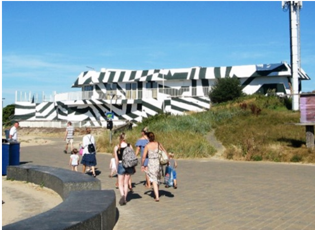
Op het strandplateau is het voormalige restaurant Blinckers een treurigstemmende blikvanger.

strand wordt nog nauwelijks rekening gehouden met de positie van het Noordhollands Duinreservaat. Dat gebied is kwetsbaar. De rust van de duinen is Castricum's kapitaal, dat toeristen en dagjesmensen aantrekt. Dit aspect moet zeker meegenomen worden in discussie over de toekomst van Castricum aan Zee. De Stichting en de Vogelwerkgroep Midden-Kennemerland zullen hun visie hierover blijven benadrukken.