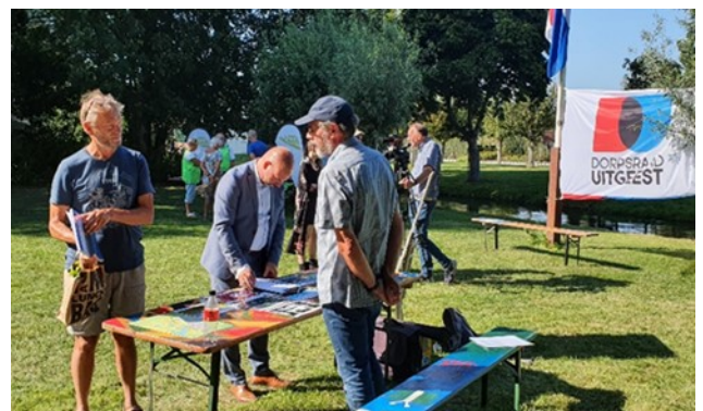
Belangstellenden bij stand van de Stichting tijdens de verenigingenmarkt in Uitgeest.

De Stichting is ingegaan op de uitnodiging van het Vrijwilligers Informatie Punt Uitgeest om zich tijdens het evenement OVER&UITgeest 2022 op zaterdag 3 september aan de inwoners te presenteren. Dat is nodig omdat Uitgeest al veel te lang niet meer binnen onze Stichting vertegenwoordigd is. Het vrijwilligers- en verenigingsevenement was verdeeld over vijf locaties met de volgende vijf thema's: Sport en Gezondheid, Natuur en Milieu, Techniek en Creativiteit, Expressie en Cultuur en Ontmoeten en Delen.