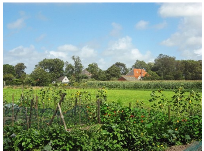
De Oosterbuurt is een authentiek stukje Castricum waar het agrarische verleden nog zichtbaar is.