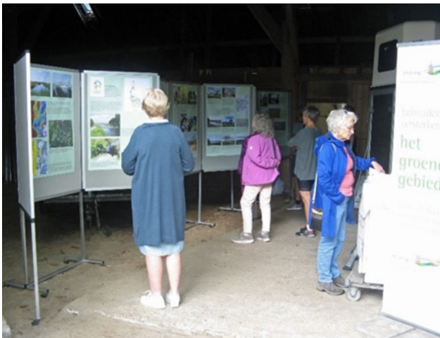
Een impressie van de tentoonstelling op de dars van boerderij Breedeweg 80.

Elk jaar is in september een Open Monumentendag. Tot nu toe heeft de Stichting daar nooit aan deelgenomen. Daarmee is een kans blijven liggen om meer naamsbekendheid te verwerven en landschappelijke zaken onder de aandacht van het publiek te brengen. Vorig jaar is daar verandering in gebracht door op zaterdag 10 september met een tentoonstelling aanwezig te zijn in boerderij Breedeweg 80 te Castricum. De titel van de tentoonstelling was 'Klimaatbestendig landschap!?' De tentoonstelling liet zien welke maatregelen rond de gemeente Castricum zijn genomen om het gebied klimaatbestendig te maken. Het vraagteken achter het uitroepteken heeft betrekking op de vraag of die maatregelen voor de toekomst voldoende zijn. Met over de 150 bezoekers kan de Stichting terugkijken op een zeer geslaagde dag. Onder de bezoekers waren buurtbewoners die nu eindelijk eens in de boerderij konden kijken. Ook waren er bezoekers die de boerderij nog in bedrijf hebben gekend of zelf op een boerderij zijn opgegroeid. Er waren ook mensen van buiten Castricum op de openstelling afgekomen. Enkele bezoekers vroegen zich af hoe de boerderij in de toekomst in deze staat behouden kan blijven. Er was niet alleen waardering voor de openstelling van de boerderij en de expositie maar er waren ook bezoekers die zich lovend uitlieten over het authentieke karakter van de Oosterbuurt.